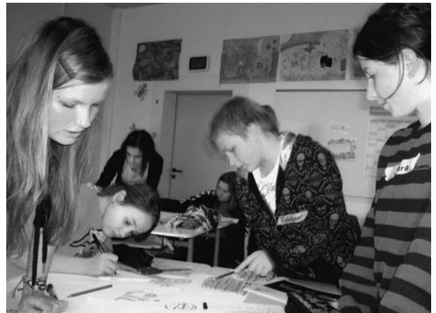
Abb. 5: Achtklässler gestalten gemeinsam ein Plakat für die Präsentation.