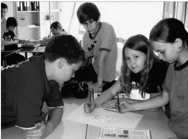
Abb. 4: Schüler/innen arbeiten gemeinsam an einer Wochenplanaufgabe.