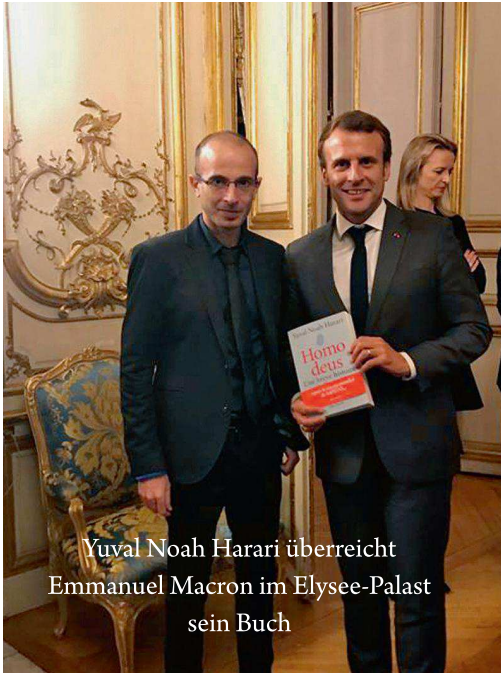
Yuval Noah Harari überreicht Emmanuel Macron im Elysee-Palast sein Buch

Nach «Eine kurze Geschichte der Menschheit» und «Homo Deus» Der neue Weltbestseller von Yuval Noah Harari