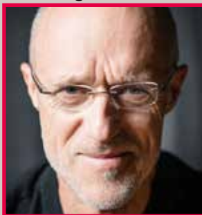
Mag. Toni Innauer

Querdenker mit Verantwortungsbewusstsein. Olympiasieger, Erfolgstrainer, Sportmanager, Philosoph und freier Autor. Mit seinem beweglichen Geist findet er immer wieder originelle Ansätze.