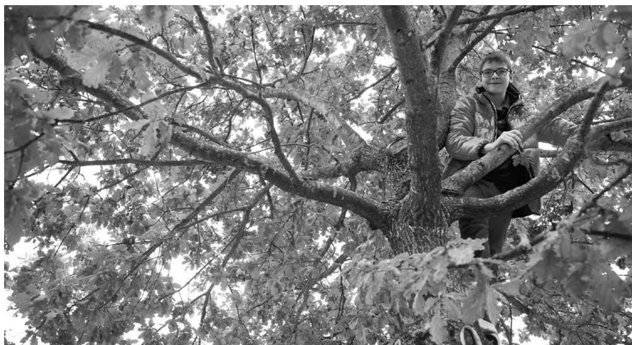
Hoch hinaus und trotzdem sicher • Sekundarschule Bürglen, Schweiz

Wenn Schulen ihre Ziele, ihr Schulprogramm und ihre Lernangebote in Auseinandersetzung mit den Bedürfnissen und Entwicklungsmöglichkeiten der Kinder und Jugendlichen festlegen, dann werden die Schülerinnen und Schüler die positiven Wirkungen dieser pädagogischen Qualitätsentwicklung unmittelbar spüren. Sie werden merken, dass ihre Lehrerinnen und Lehrer sich für ihre Lebenssituation interessieren, und diese zum Ausgangspunkt gemeinsamen Lernens machen. Sie werden sich von ihren Lehrerinnen und Lehrern verstanden fühlen, weil ihre Bedürfnisse und Sichtweisen gefragt sind, zum Beispiel wenn es um die Gestaltung von Schulräumen oder von Lernangeboten geht. Das heißt aber nicht, dass alle Bedürfnisse befriedigt werden müssen und können, vielmehr wird in Auseinandersetzung mit sinnvollen Grenzen und in