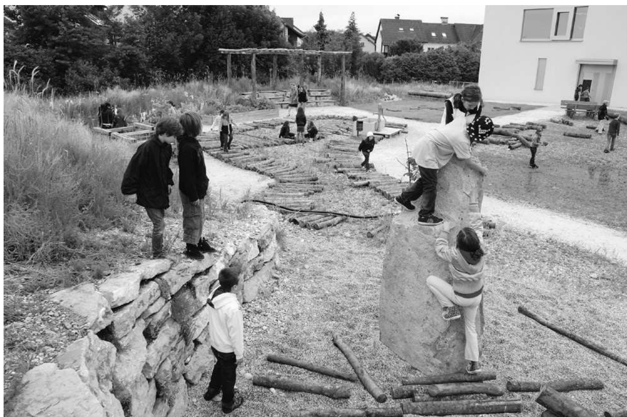
Kletterfelsen • Volksschule 5 Wels-Maut, Österreich