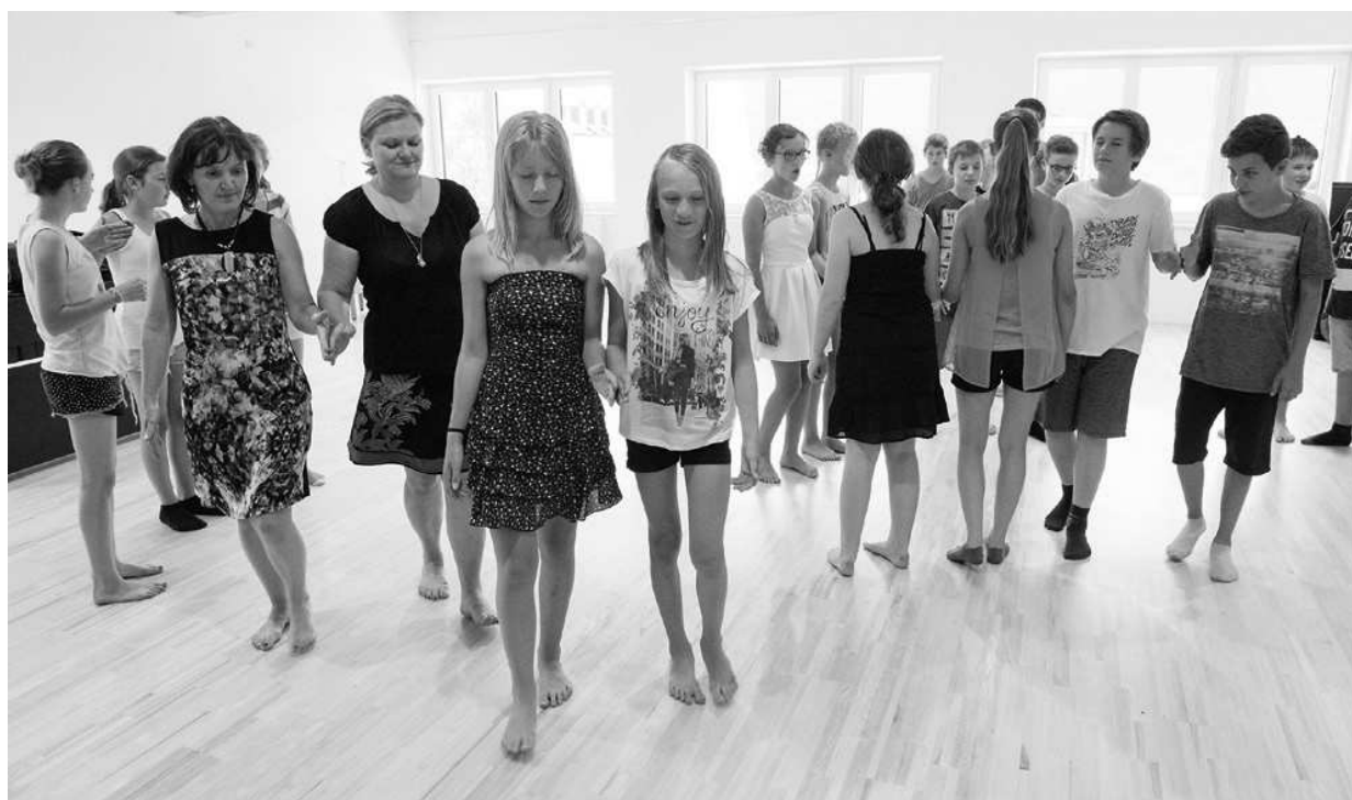
Musik-Mittelschule Eggelsberg, Österreich