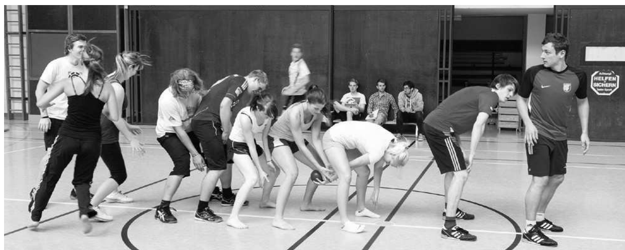
Pädagogische Hochschule der Diözese Linz, Österreich (Bewegung und Sport)

Eine Bewegte Schule bietet mehr als Bewegungspausen für einen ansonsten wenig anregenden Sitzununterricht. Sie ist Teil einer neuen Lernkultur, in der Schülerinnen und Schüler aktiv handeln und bewegt lernen können. Sehr viele Schulen haben bereits begonnen, sich auf die persönlichen Voraussetzungen und Entwicklungsmöglichkeiten der einzelnen Schülerinnen und Schüler auszurichten. Sie haben es sich zur Aufgabe gemacht, die Unterschiedlichkeit der Lernenden als positive pädagogische Herausforderung anzunehmen: Alle sollen im Unterricht »mitkommen«, mit Freude lernen und individuell bestmögliche Leistungen erreichen können. Die Wege, auf denen Schulen diese Ziele erreichen wollen, sind ebenso unterschiedlich wie die Begriffe, die dafür benutzt werden: personalisiertes Lernen, kompetenzorientierter Unterricht, bewegtes Lernen, Lernlandschaften, binnendifferenzierter Unterricht, Arrangements für selbstkompetentes Lernen – diese und weitere Begriffe stehen für eine neue Lernkultur, die Lernen als aktiven, selbstgesteuerten, situativen und konstruktiven Prozess versteht. In einer Bewegten Schule , die einem solchen (auch bewegungspädagogisch gut begründbaren) Verständnis nachhaltigen Lernens folgt, eröffnen sich vielfältige Handlungsfelder, in denen Initiativen für eine bewegungsorientierte Profilbildung ergriffen werden können (→ Teil II).